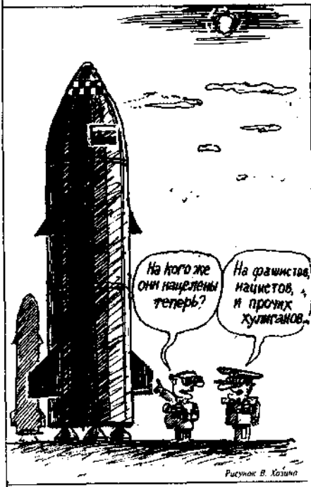
Рисунок В. Халина

* Монархический проект я не рассматриваю, ибо считаю его вредной утопией.